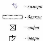
План цокольного этажа